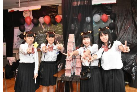
<倉持君の壮行会的一幕>